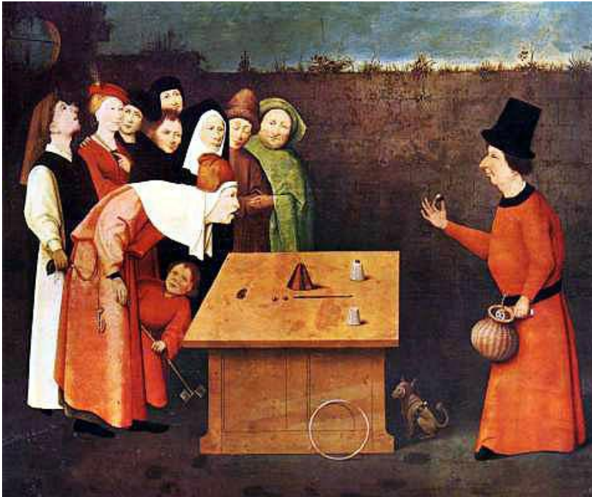
Hieronymus Bosch (1450 –1516) „Der Gaukler“ 24

Verstecken - durch Zeigen 23 : verstecken dessen, was sie uns nicht zeigen, etwas anderes zeigen: ein alter Trick, älter als dieses Bild des mittelalterlichen Gauners: