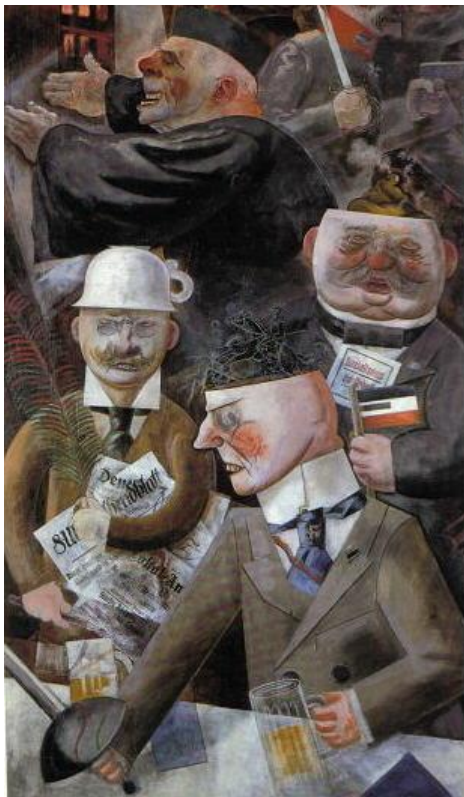
George Grosz Die Stützen der Gesellschaft 1926 48

Verblendung, Verleugnung dessen, was wir anderen antun. Verleugnung: die zentrale Dimension, die uns ermöglicht, als „Stütze der Gesellschaft“ zu fungieren.